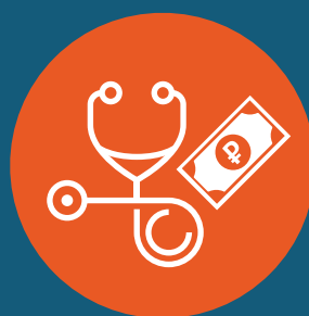
Оплата диагностических процедур